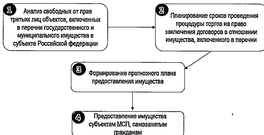
Рисунок 2. Схема формирования прогнозного плана предоставления имущества

9.13. Схема формирования прогнозного плана предоставления имущества отражена на Рисунке 2.